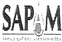
TABLA DE APLICABILIDAD

SISTEMA DE AGUA POTABLE Y ALCANTARILLADO MUNICIPAL San Cristóbal de Las Casas, Chiapas