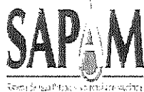
TABLA DE APLICABILIDAD SISTEMA DE AGUA POTABLE Y ALCANTARILLADO MUNICIPAL San Cristóbal de Las Casas, Chiapas