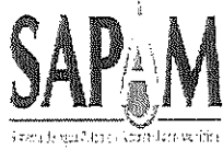
TABLA DE APLICABILIDAD

SISTEMA DE AGUA POTABLE Y ALCANTARILLADO MUNICIPAL San Cristóbal de Las Casas, Chiapas