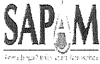
TABLA DE APLICABILIDAD

SISTEMA DE AGUA POTABLE Y ALCANTARILLADO MUNICIPAL San Cristóbal de Las Casas, Chiapas