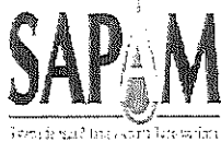
TABLA DE APLICABILIDAD SISTEMA DE AGUA POTABLE Y ALCANTARILLADO MUNICIPAL San Cristóbal de Las Casas, Chiapas