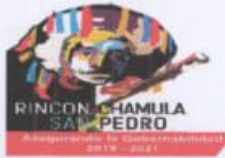
TABLA DE APLICABILIDAD H. Ayuntamiento Rincón Chamula San Pedro