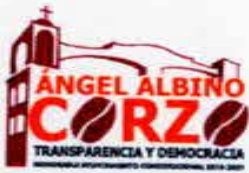
TABLA DE APLICABILIDAD H. AYUNTAMIENTO ANGEL ALBIÑO CORZO